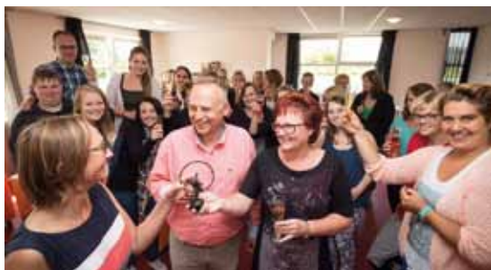
Auti-Start krijgt de Autismevriendelijkheidsprijs voor organisaties.