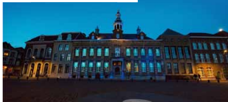
Aandacht voor autisme met de wereldwijde actie: Light it up Blue.