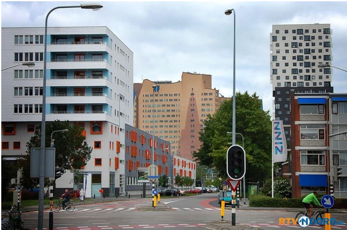
Foto vanaf het Overwinningsplein. Het gebouw links met de oranje kozijnen is Confiance. Op de achtergrond de Apenrots (Gasunie) en helemaal rechts La liberté.

Info: http://www.autisme.nl/regio/groningen-en-drenthe/activiteitenkalender-groningen-en-drenthe onder Auticafé