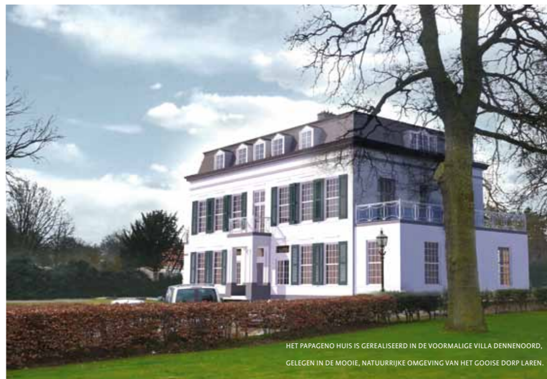
HET PAPAGENO HUIS IS GEREALISEERD IN DE VOORMALIGE VILLA DENNENOORD, GELEGEN IN DE MOOIE, NATUURRIJKE OMGEVING VAN HET GOOISE DORP LAREN.

Het is bijna zo ver: in april opent het Papageno Huis in Laren haar deuren. En daarmee komt een wens van Aaltje en Jaap van Zweden in vervulling. Een wens om voor kinderen en jonge mensen met autisme een veilige plek te realiseren waar ze leren zelfstandig te wonen en mee kunnen doen aan dagbesteding- en werkervaring programma's. Een huis bovendien waar jonge mensen met én zonder autisme zich samen kunnen inspannen en ontspannen op het gebied van kunst en cultuur, sport en spel.