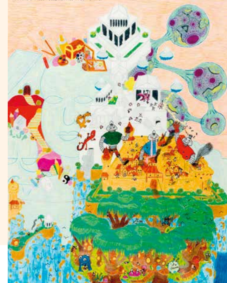
COEN: 'HELEMAAL BOVENAAN STAAT EEN GRIEKSE TEMPEL. OM DAAR TE KOMEN MOET JE LANGS EEN AANTAL CHALLENGES, NET ALS IN EEN GAME.'

tekening staat een Griekse tempel. Om daar te komen moet je langs een aantal challenges , net als in een game. Zo is er de middeleeuwse stad die wordt aangevallen door reuzen en een moeras waar inboorlingen - dat bedoel ik overigens niet verkeerd - wonen in hutjes. 4 jaar geleden zat ik nog op het Auriscollege waar ik het vak beelden de vorming volgde. Ik was daar heel goed in en toen mocht ik naar een speciale klas. Met die klas ging ik op excursie bij de Herenplaats waar ik stage kon gaan doen. Nu ben ik hier vast. Ik kom elke dag rond 9 uur op de zaak en dan ga ik eerst stripboekjes lezen om bij te komen. Daarna ga ik aan de slag.'