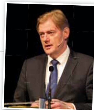
STAATSECRETARIS MARTIN VAN RIJN MAAKTE DE SLOGAN VOOR DE AUTISMEWEEK 2015 BEKEND OP HET NVA AUTISMECONGRES

In 2015 organiseren de NVA en het AutismeFonds voor de zesde keer de Autismeweek rondom 2 april, Wereld Autisme Dag.